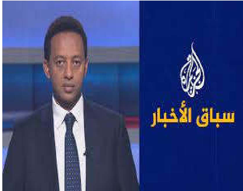
عثمان آي فرح: مقدم برنامج سباق الأخبار