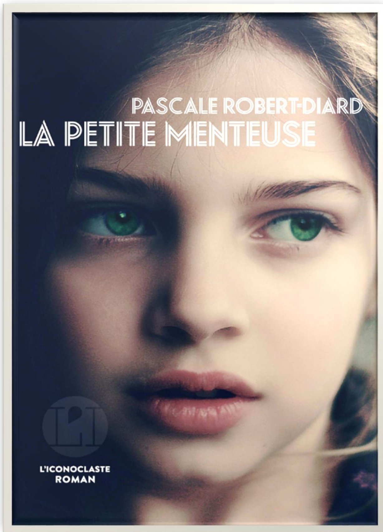
La première couverture de la petite menteuse