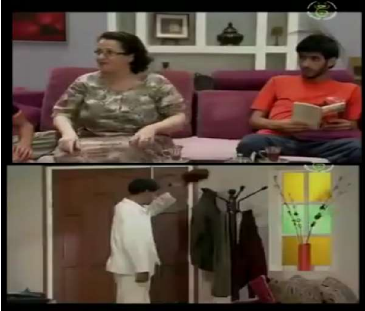
فوتو غرامات مستخرجة من المشهد رقم 01 من الحلقة 15 من الجزء الأول

وهذا دليل على أن المخرج ركز على إبراز وتجسيد معظم خصائص الفكاهة والكوميديا لإضحاك أكبر عدد من المتفرجين، حيث وظف أساليب الاستعارة والكناية لإبراز هذا الفن الكوميدي الفكاهي في أحسن صورة، لكن طغت المبالغة أكثر وأكثر في هذا الفن الذي يجعلنا نضحك ونسخر من بعضنا البعض في مثل هذه اللامات العائلية، مثل ما استقبل الجمعي مفاجأة مريم له بطريقة استهزائية جعلت زوجته مريم تشعر بأنه يسخر منها وغير مهتم بما تقوله، وهذه الطريقة الاستهزائية لا تصلح في مثل هذه المواقف الجادة.