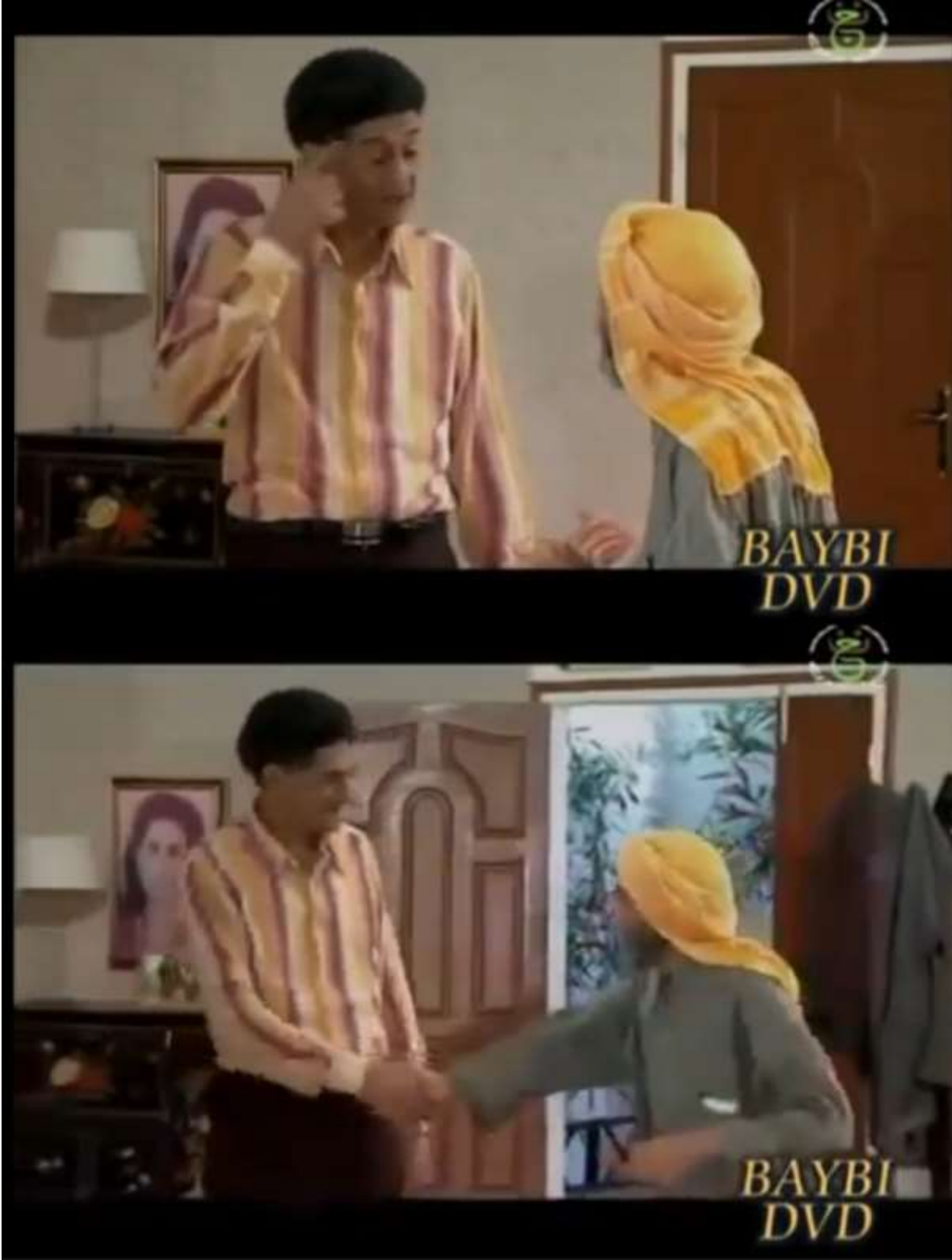
فوتوغرامات مستخرجة من المشهد رقم 03 من الحلقة 04 من الجزء الأول