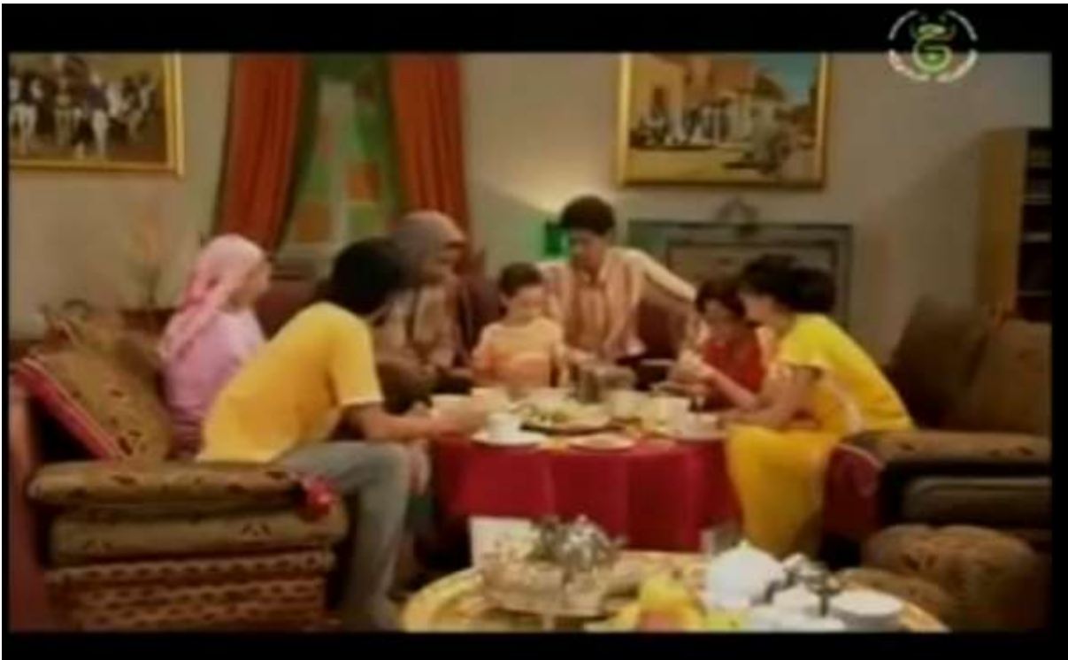
فوتوغرامات مستخرجة من المشهد رقم 01 من الحلقة 07 من الجزء الاول