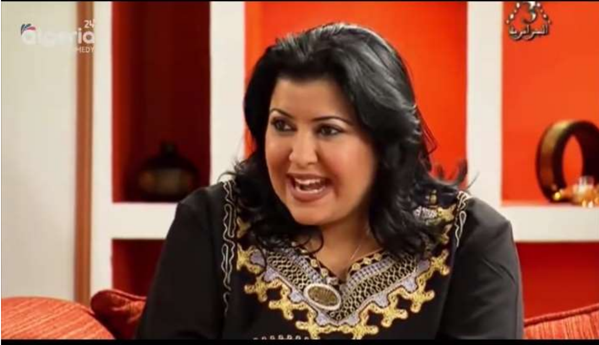
فوتو غرامات مستخرجة من المشهد رقم 03 من الحلقة 02 من الجزء الثاني