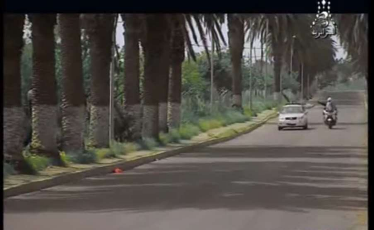
فوتو غرام مستخرج من المشهد رقم 02 من الحلقة 04 من الجزء الثالث

هذه العبارات تدل على تفريط الأب لابنه عند محاولة إقناعه بدخول السجن والتضحية من أجل العائلة، ومن المفروض أن الأب رب البيت هو رمز التضحية في حياة ابنه، هو الذي يعمل جاهداً ويضحي لحماية عائلته، لكن المخرج جسد هذا الموضوع بطريقة استهزائية ومضحكة من خلال استخدام الجمعي لعبارات مضحكة مثل قوله أنت تروح للحبس وأنا وماما نجيبولك القفة، وأخرى استهزائية في قوله شحال راح يحكمو عليك يا ربي عشر سنين.