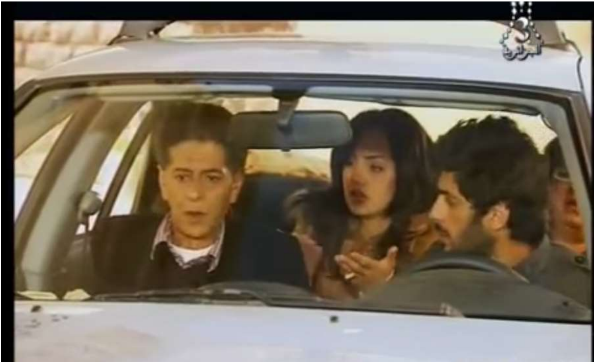
فوتو غرام مستخرج من المشهد رقم 01 من الحلقة 15 من الجزء الثالث

وتظهر أيضا ملامح الفكاهة في هذا المشهد بقول الجمعي ياو طبطب، فالمخرج هنا أراد إيصال رسالة للمشاهدين لكن بطريقة مضحكة حبذا لو تجنب عرض مثل هذه المواضيع والمواقف الصعبة بطريقة فكاهية مزاحية.