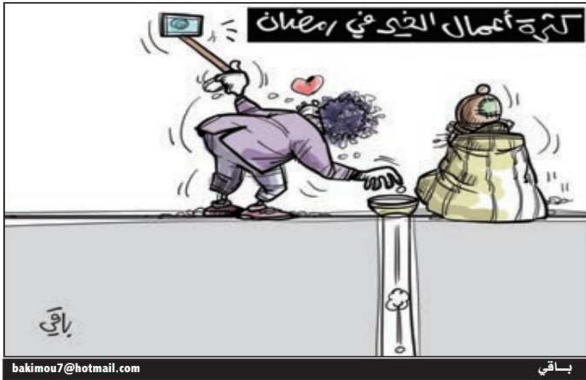
الملحق رقم 12: صحيفة الشروق الإلكترونية يوم 29 مارس 2023 / العدد: 7365