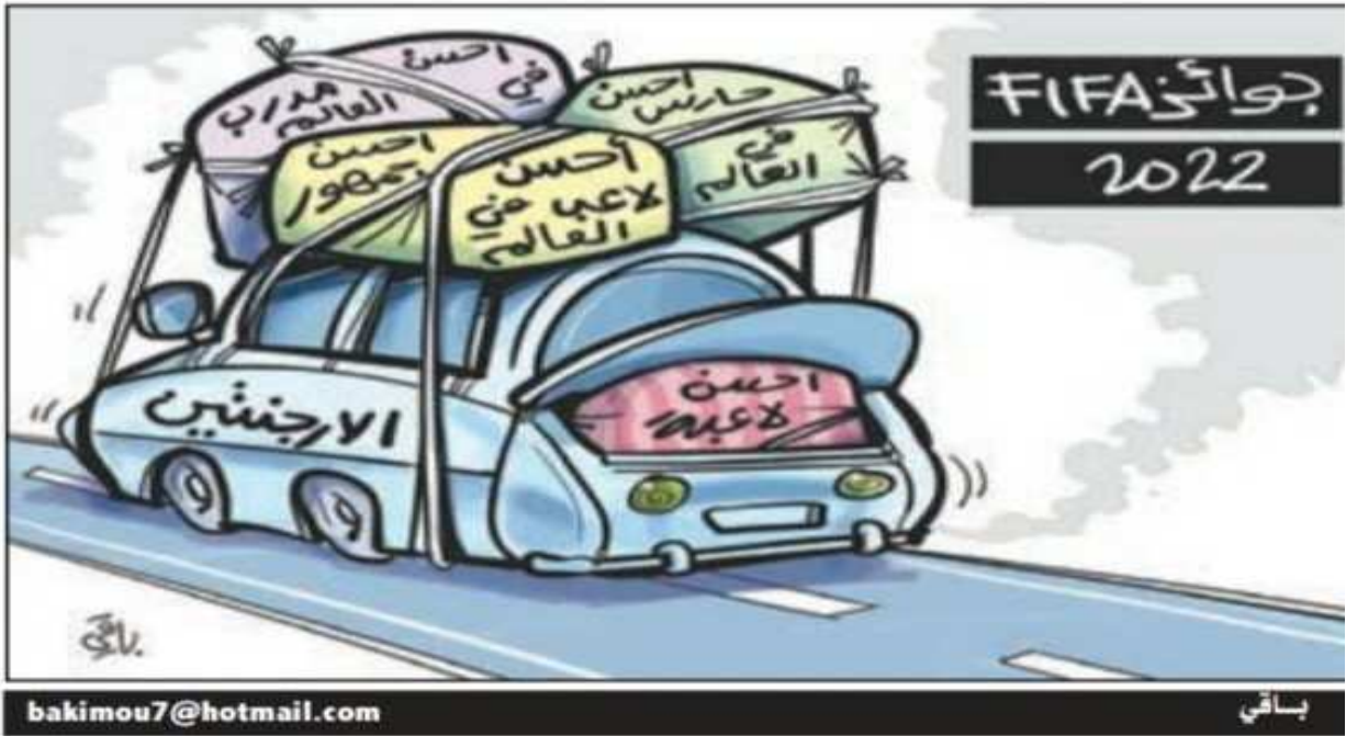
الملحق رقم 09: صحيفة الشروق الإلكترونية يوم 01 مارس 2023 / العدد: 7341