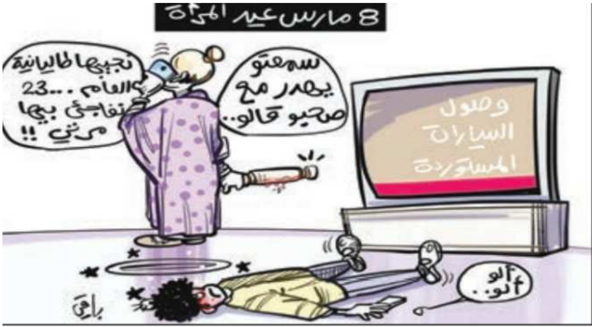
الملحق رقم 11: صحيفة الشروق الإلكترونية يوم 08 مارس 2023 / العدد: 7347