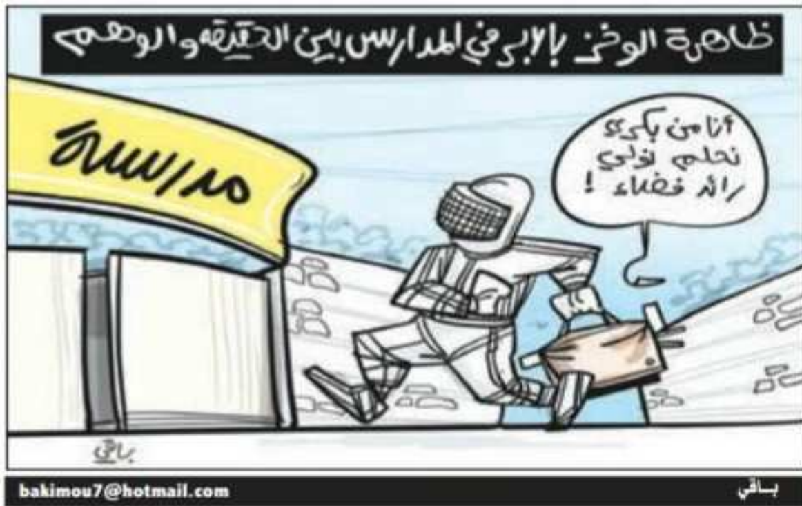
الملحق رقم 10: صحيفة الشروق الإلكترونية يوم 07 مارس 2023 / العدد: 7347