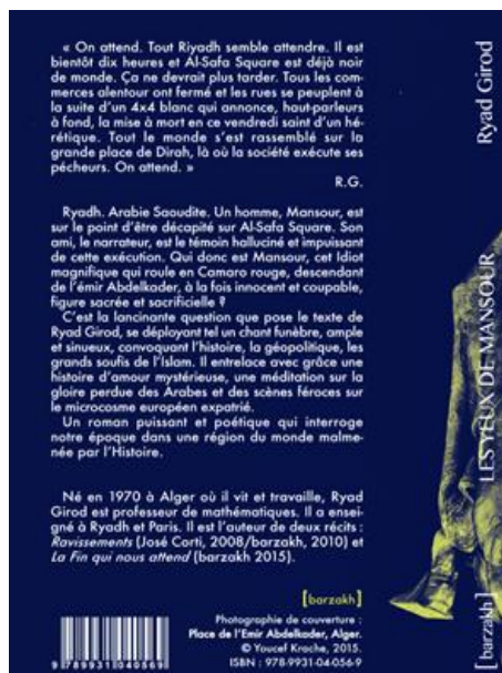
Figure 2(la quatrième de couverture)