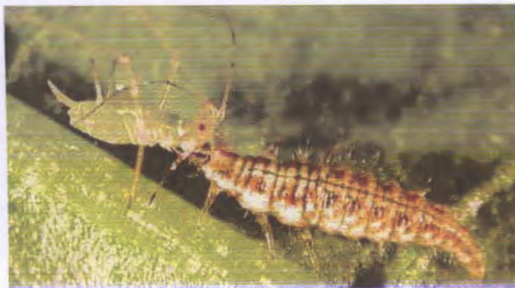
Figure 3: Larve de chrysope dévorant un puceron.

Toute sa vie, la coccinelle est le prédateur naturel des pucerons, à l'état larvaire comme à l'âge adulte. Elle pond ses œufs sous les feuilles et quelques heures après leur naissance, les larves de coccinelles commencent à engloutir les pucerons. Une coccinelle adulte, ou même une grosse larve, en dévore plus d'une centaine par jour ( www.sc.hc.gc.ca ).