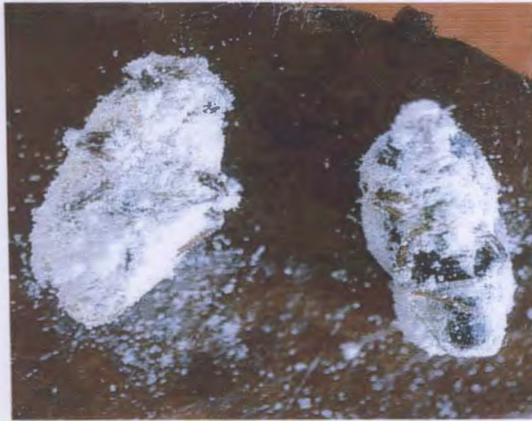
Figure2: Beauveria bassiana développé à la surface des Punaises.