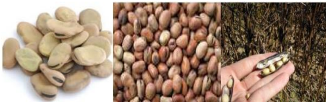
Vicia faba major