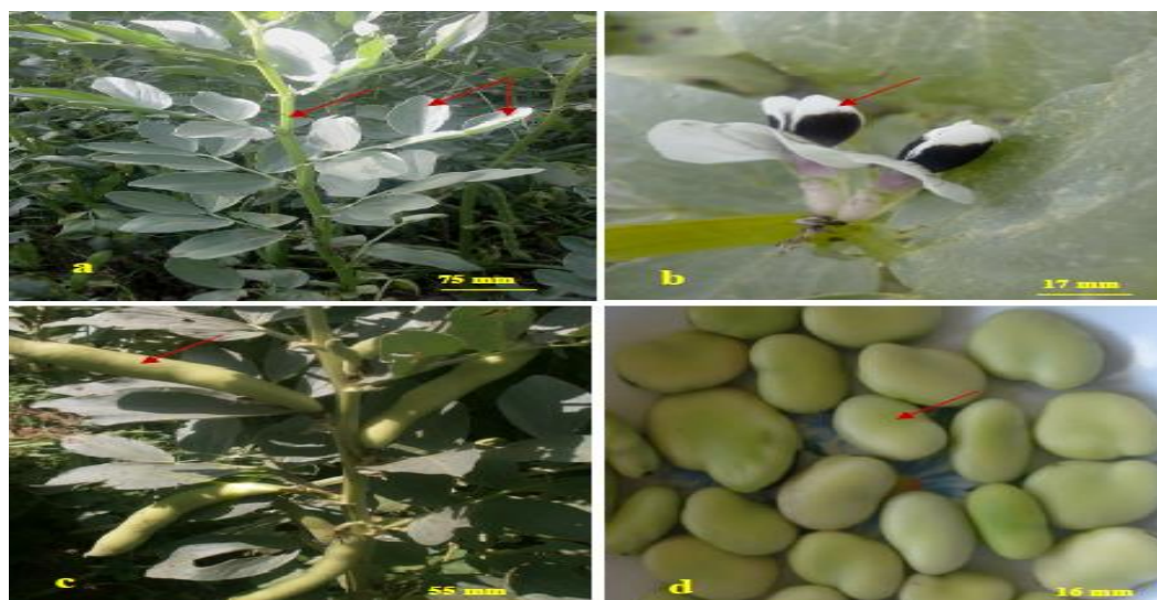
Figure 01 : Aspect morphologique de Vicia faba .

La racine comporte un pivot et des ramifications, surtout abondantes en surface. Les nodosités sont présentes dans les trente premiers centimètres ( Boyeldieu, 1991 ).